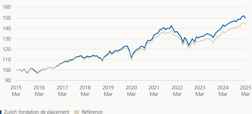
Performance (brute, indexée)

Le groupe de placement investit dans des actions, des obligations, des hypothèques, des placements immobiliers et alternatifs dans le monde entier. La combinaison de catégories de placement traditionnelles et non traditionnelles, historiquement peu corrélées entre elles, vise essentiellement à optimiser le rendement en utilisant les actions de manière renforcée et en enregistrant des fluctuations de valeur importantes.