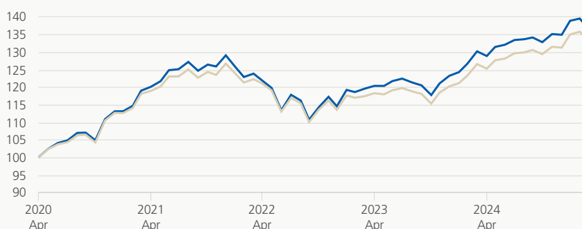
Monatsrendite (brutto, indiziert)

Die Anlagegruppe investiert weltweit in Aktien, Obligationen, Immobilien, Hypotheken und alternative Anlagen. Die Kombination traditioneller Anlagekategorien und nicht traditioneller Anlagekategorien, die historisch schwach korreliert sind, bezweckt hauptsächlich die Optimierung der Rendite, bei verstärktem Einsatz von Aktien und höheren Wertschwankungen.