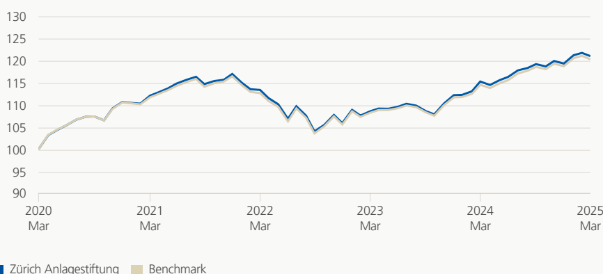
Monatsrendite (brutto, indiziert)

Die Anlagegruppe investiert weltweit in Aktien, Obligationen, Immobilien und alternative Anlagen innerhalb der aktuellen, gültigen Vorgaben im Rahmen des Bundesgesetzes über die berufliche Alters-, Hinterlassenen- und Invalidenvorsorge (BVG/BVV2). Der strategische Aktienanteil beträgt 20%.